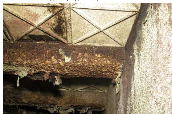
Figura 5. Degradación por ataque ácido en pozo.

Los daños son muy severos en los paramentos de algunas galerías así como en el pozo de compensación y retorno, principalmente en las bóvedas y en las zonas por encima del nivel habitual del agua (Figura 5).