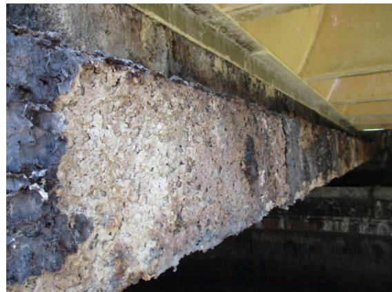
Figura 4. Degradación por ataque ácido tras reparación y protección superficial.

El fuerte deterioro que produce este agente se debe a la reacción del ácido en contacto con la superficie básica del hormigón, que ocasiona procesos de disolución de todas las fases cálcicas de la pasta de cemento hidratado (Figura 4).