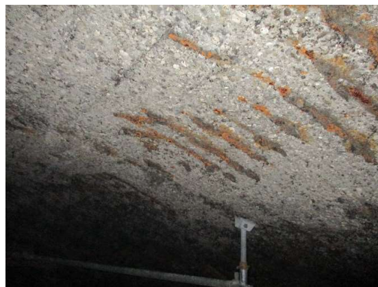
Figura 1. Ataque ácido en bóveda de digestor.

estación depuradora de aguas residuales (EDAR) con este tipo de deterioro.