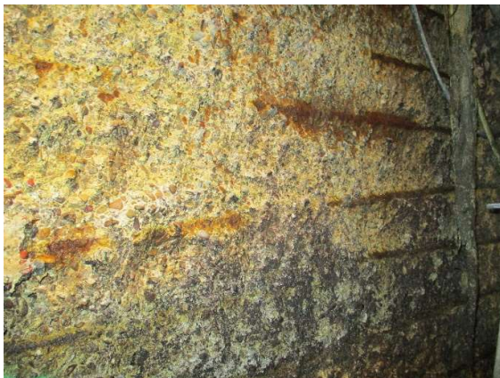
Figura 3. Degradación severa por ataque ácido con intensa corrosión de armaduras.

Respecto al espesor de hormigón afectado, la degradación por la acción del ácido sulfúrico ocasiona una acusada pérdida de material en la capa más superficial del hormigón, llegando en muchos casos a degradar por completo el espesor de recubrimiento íntegro y producir una acusada corrosión de las armaduras, con importantes pérdidas de sección del acero (Figura 3).